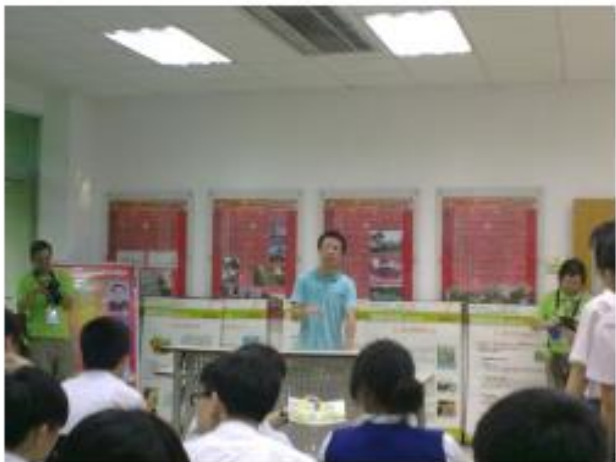
科普小组成员作科普展示

通过此次交流，增进了两基地的友好关系，开拓了眼界，了解了基地的科普展示情况。香港中华总会中学的老师们增长了科普展示的经验，为今后两基地的科普展示工作提供了有益的借鉴。